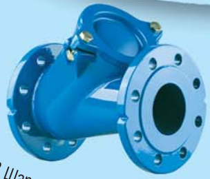
402 Шаровой обратный Клапан 2"-14", Ру10/16