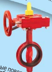
Межфланцевые поворотные заслонки модели 107F Ду2"-8", 175 Psi (12.5 Bar)