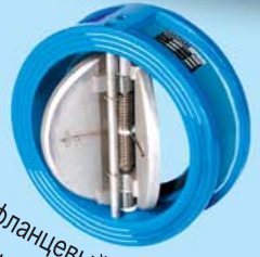
Межфланцевый обратный клапан с двойным диском Ду50-600 2"-24", Ру16