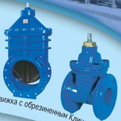
Задвижка с обрезиненным Клином 2"-48", Ру10/16/25