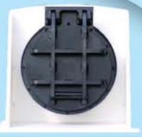
Щитовой затвор из Полиэтилен и откидной клапан