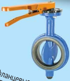
Межфланцевые поворотные заслонки модели 107 Ду50-600 2"-64", Psi10/16