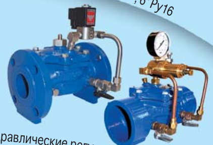
Гидравлические регулирующие клапаны Ду25-300, 1"-12" Psi16