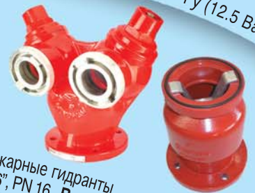
Пожарные гидранты 2"-6", PN 16 Breaking Device 4", 6" Psi16