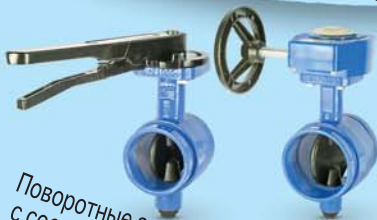
Поворотные заслонки модели 111 с соединением "Виктаулик"