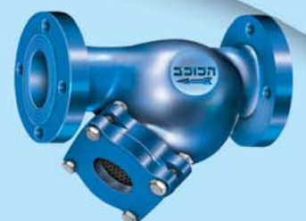
"Y" Сетчатый фильтр, 2"-12", Ру16