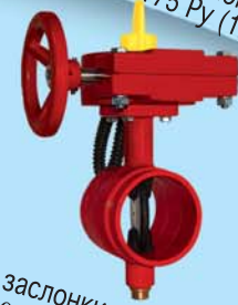
Поворотные заслонки модели 111F Ду80-200, 3"-8", 175 Psi (12.5 Bar)