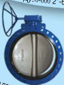
Фланцевые поворотные заслонки модели 116 Ду700-1800 28"-64", Psi10/16/25