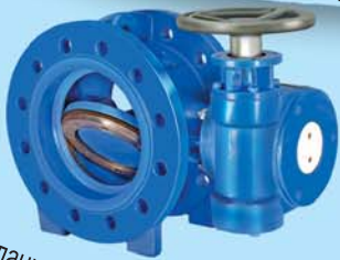
Фланцевые Эксцентрик поворотные заслонки Ду150-2500, 6"-100", PN10/16/25/40