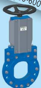
Задвижка модели "Zeta" Ду50-1000 2"-40", Ру2.5/6/10/12