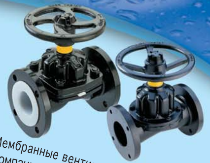
Мембранные вентиля типа W/типа ST компании "KIM" 1/4"-14"

В 2011 г. компания "Hakohav Valves" приобрела хорошо известную (с 1987 г.) компанию по производству водомеров "Maded Vered" ("MV"). Водомеры компании "MV" – то стандартные домашние и коммунальные водомеры с современными уникальными технологиями, подобными системе автоматического считывания данных (AMR).