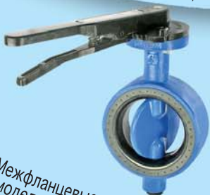
Межфланцевые поворотные заслонки модели 102 Ду80-600, 3"-24", Psi16/25