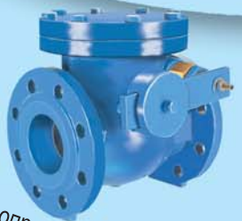
Полнопроходной обратный клапан 604 Ду65-1000, Ру10/16/25/40