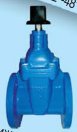
Клиновая задвижка модели HAV (фланцы AWWA) Ду50-600 2"-24", Ру16