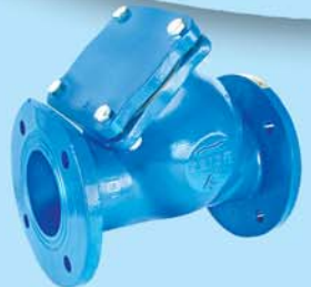
302 "Y" Обратный Клапан 3"-8", Ру16